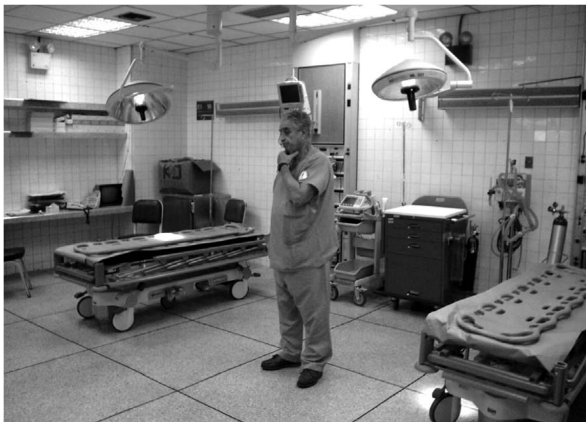
Unidad de Politraumatizados "Dr. Fernando Rodríguez Montalvo". Fundada el 20 de diciembre de 1990.