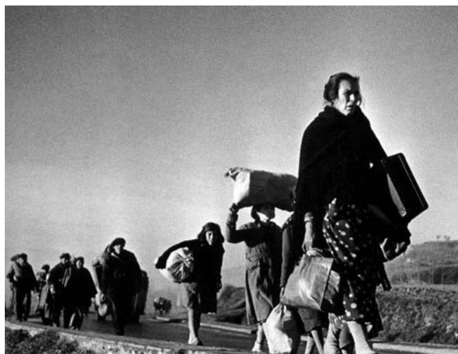
El exilio. Refugiados de la Guerra Civil Española en la carretera de Barcelona, camino a la frontera francesa, enero de 1939.

Española, de 1936 a 1939, ocasionada por una mentalidad inquisidora, seguida esta confrontación por la II Guerra Mundial, de 1939 a 1945, producto de un monstruo apocalíptico. De la Guerra Civil tengo en mi memoria los relatos de mis padres y de la II Guerra Mundial mantengo recuerdos imborrables. Nuestra eterna gratitud a Francia por habernos acogido en aquellos días tan difíciles y sobretodo por haber aprendido a leer, escribir y hablar un nuevo idioma.