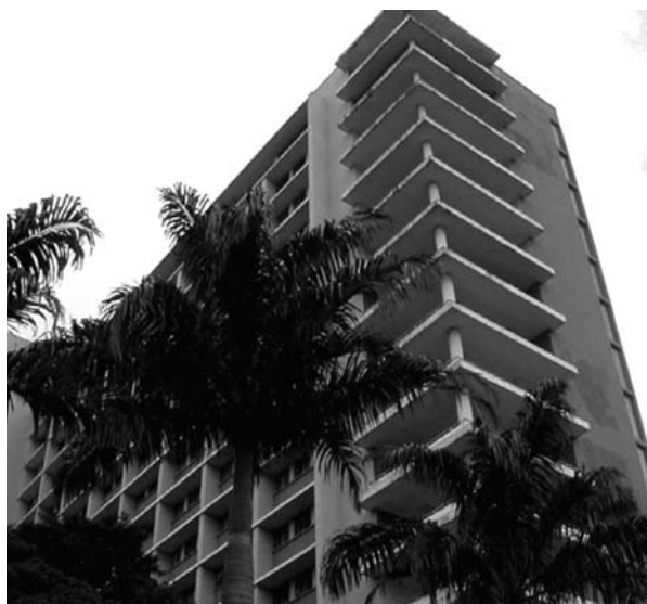
Hospital Dr. Ildemaro Salas. Ocupaba áreas ( ala norte ) del Hospital Militar Carlos Arvelo.

En 1961 entré como residente quirúrgico del Hospital General "Dr Ildemaro Salas". En aquel tiempo era el único hospital quirúrgico en el área metropolitana de la Seguridad Social y gracias al gran volumen de pacientes pudimos adquirir una buena experiencia en la cirugía general y de emergencia. Durante estos cuatro años, los residentes tuvimos la gran suerte de contar con un excelente grupo de profesores, que nos fueron formando en el buen saber del bello arte quirúrgico.