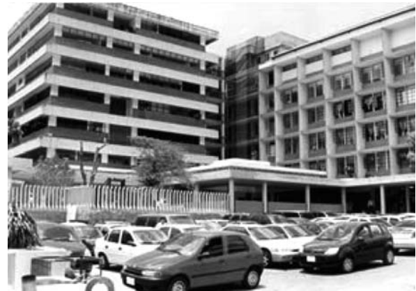
Hospital Oncológico Padre Machado.