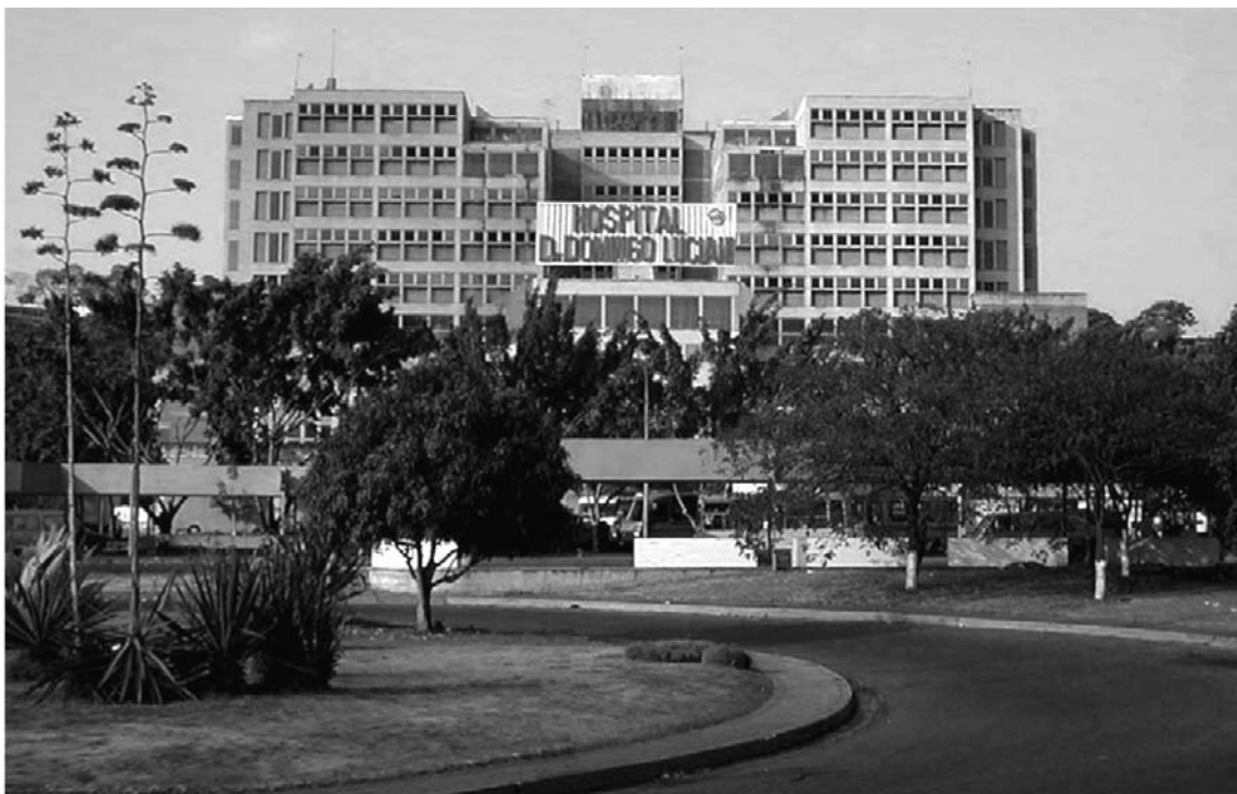
Hospital General de Este "Dr. Domingo Luciani"