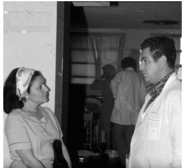
Durante el desarrollo del ejercicio profesional