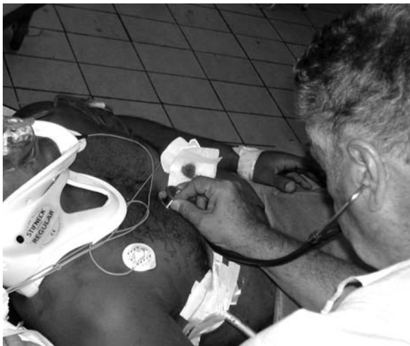
"Siempre estaremos en deuda con él"

Por regla general se nos olvida agradecer a dos seres especiales, como son el paciente y la enfermera. Al enfermo hospitalario siempre hay que recordarlo como nuestra verdadera fuente de enseñanza. Se entrega totalmente y por regla general nos agradece por haberle salvado la vida o aliviado su dolor. Siempre estaremos en deuda con él. Nuestra gratitud y admiración a las enfermeras por estar a nuestro lado aportándonos muchas enseñanzas que no aparecen en los libros de cirugía.