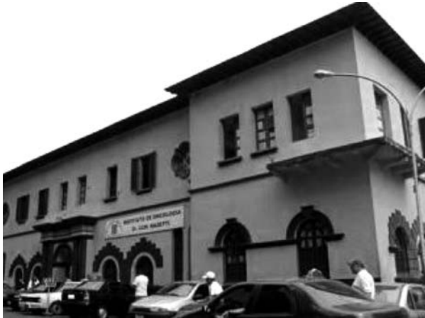
Insituto Oncológico Luis Razetti, en la antigua casona donde funcionaba la Escuela Nacional de Enfermería.

cial, como es el paciente oncológico, el cual necesita de muchos cuidados, dedicación y sobretodo de un gran apoyo humano.